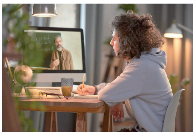
38% dos estudantes buscaram formação online por ter horas vagas e 25% com o objetivo de melhorar o currículo